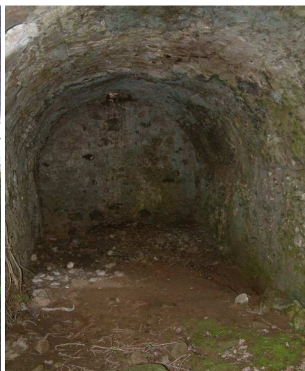
Figura 4 Interno della cisterna