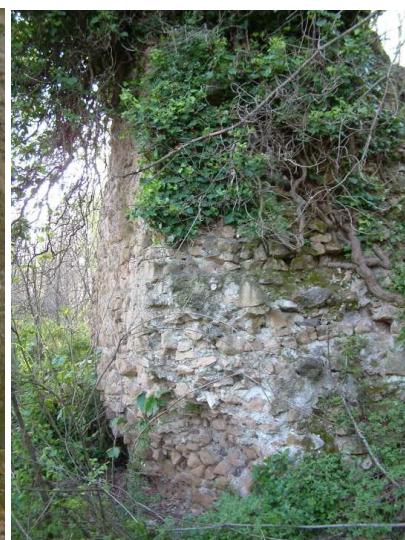
Figura 5 Parte del muro perimetrale

Castel Pilano, appare come un fortilizio antico, un castrum , appunto