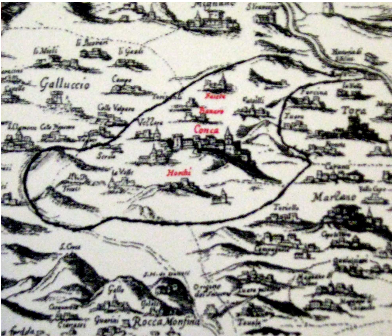
Figura 6 (Stralcio della Carta del De Guevara del 1635)

La mia seconda ipotesi di percorso vede Castrum Pilanum ubicato sulla pianura de La Valle , prospiciente il fiume Pubbico così come si potrebbe evincere da una cartina topografica elaborata nel 1635 dalla Diocesi di Teano ( detta del De Guevara ) e molto diffusa dalle nostre parti.