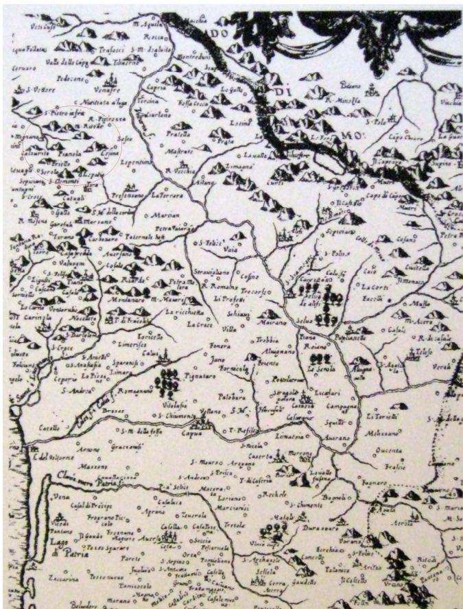
Figura 2 (Stralcio della Carta del Magini del 1630)

Ho localizzato la zona tenendo ben presente la topografia del luogo comparandola con la topografia antica della Carta del Magini del 1630 .