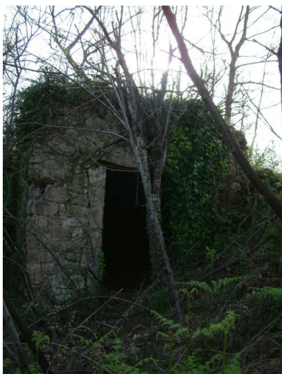
Figura 3 Ingresso alla cisterna